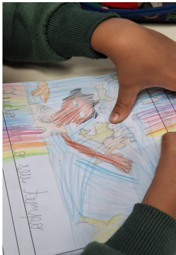
Atividades pedagógicas realizadas a partir de uma perspectiva centrada em África.

Por meio de um Acordo de Cooperação Internacional, assinado entre Moçambique e Brasil, formalizado via Departamento de Relações Internacionais da UFMG (DRI) no ano final do ano de 2023, diversas ações interculturais vêm sendo planejadas e realizadas entre docentes e discentes de ambos os países, visando enegre(SER) o pensar e o sentir sobre o continente africano, descolonizando assim o currículo formal, hegemônico e eurocentrado.